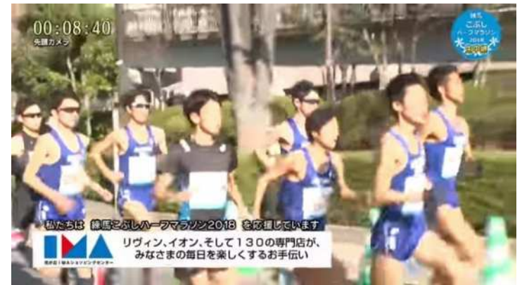
大会生中継バナー広告(イメージ)

参加ランナーを自宅で応援するご家族等に向けたPRが可能です。 YouTube配信により、大会終了後も引き続き視聴できます。